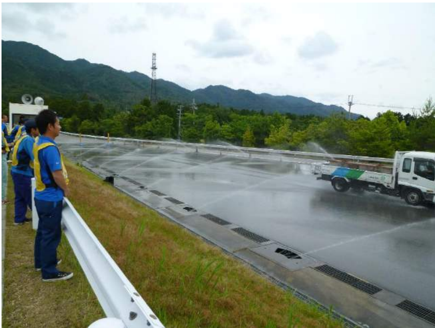
研修施設での安全研修受講風景