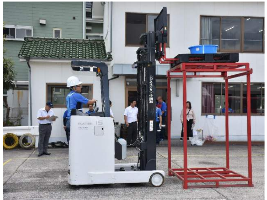
リフト研修受講風景