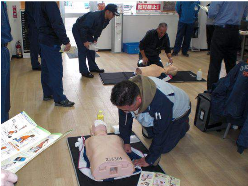
救急救命講習会風景