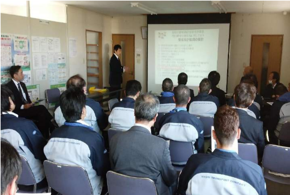
インストラクター会議の様子 NASVAの適性診断活用講座を受講